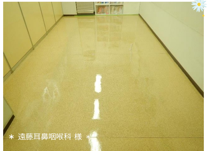
* 遠藤耳鼻咽喉科 様 *

白十字伊福町店様・遠藤耳鼻咽喉科様のウィナッフメンテナンス実施しました。光沢性と耐久性にとっても優れているコーティングで、白十字様は9ヵ月・遠藤耳鼻咽喉科様は10ヵ月ぶりの施工となりました。床がピカピカになり室内が明るくなりました。