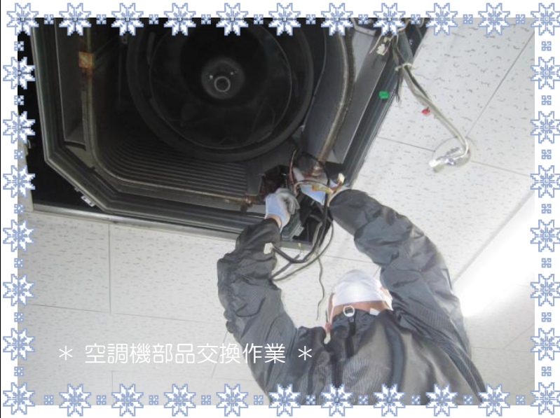
* 空調機部品交換作業 *

当社では、エアコン修理、クリーニング、更新工事など 全てのメーカーに対応出来ます！