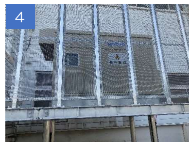
3、4 架台の上に非常用発電機を設置！