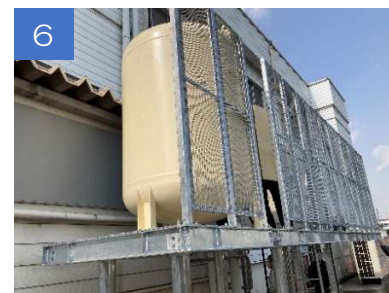
5、6 同じく架台上にLPガスバルク貯槽設置！