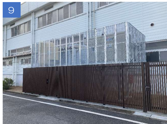
7、8 まわりをフェンスで囲っていきます。 9 完成！