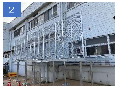
1、2 前号で完成した架台にフェンスを取り付けます。