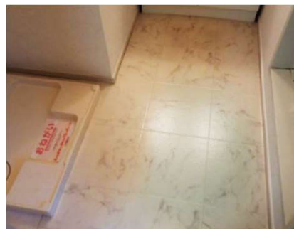
○洗面所CFに青いシミがある為、張替えいたしました。

株式会社 建美装社 福岡営業所 〒802-0831 福岡県北九州市 小倉南区八重洲町7番12号