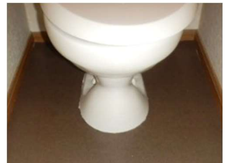
○トイレの便器付近のCF（クッション材）に切れ目が入っている為、張替えをしました。