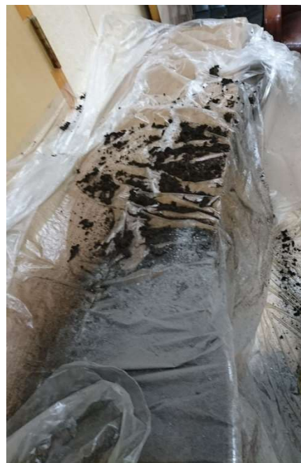
↑清掃した換気扇から出た汚れ

新型コロナウイルス感染症対策において「換気」が非常に有効です。しかし、実際に風量の確認をしてみると、十分な換気が出来ていない場合も多いです。