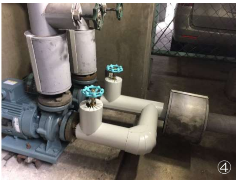
①吸水バルブ交換後 ②揚水ポンプ交換後 ③吸水配管保温材施行後 ④吸水配管ラッキング施行後