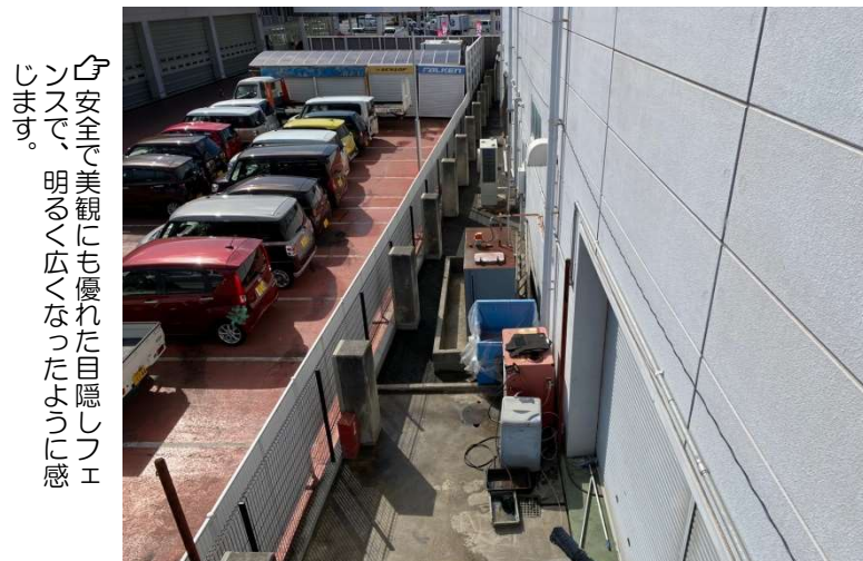
安全で美観にも優れた目隠しフェンスで、明るく広くなったように感じます。