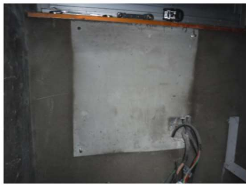
☞制御盤取り外し後